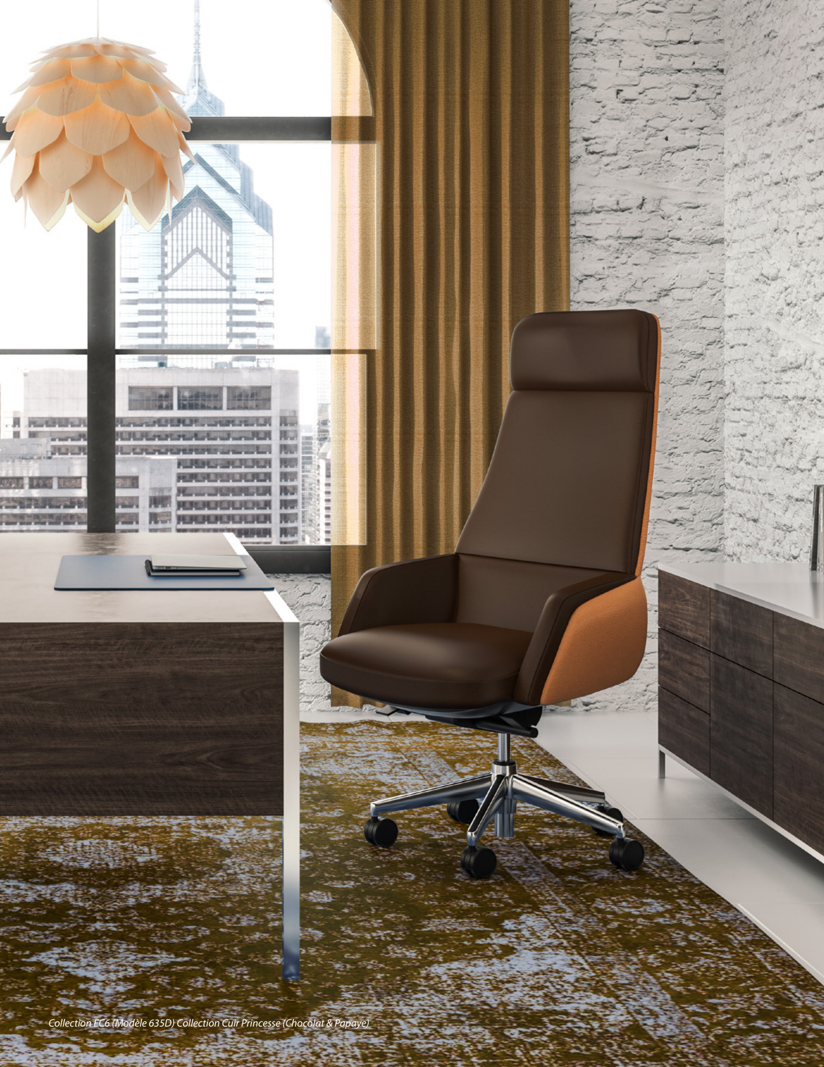
Collection EC6 (Modèle 635D) Collection Cuir Princesse (Chocolat & Papaye)