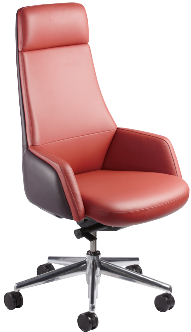
Madras // COQUELICOT & BORDEAUX 635D