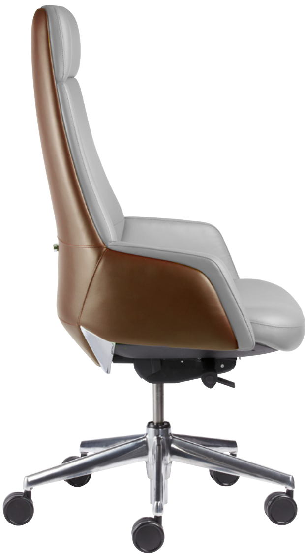
Princesse // BRUME & AMANDE 635D

La collection EC6 peut être rembourrée en utilisant des tissus, vinyles et cuirs de grande qualité. Nous avons une grande variété de couleurs et de tons.