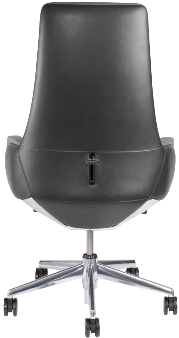
Vinyle Standard // ACIER 635D