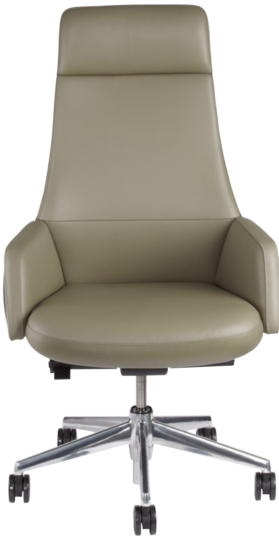
Cuir Plus // PAVÉ 635D

Faites-nous confiance — nous avons facilité la personnalisation de votre chaise favorite. Pour plus de renseignements, visitez : www.nightingalechairs.com/MyChairMaker