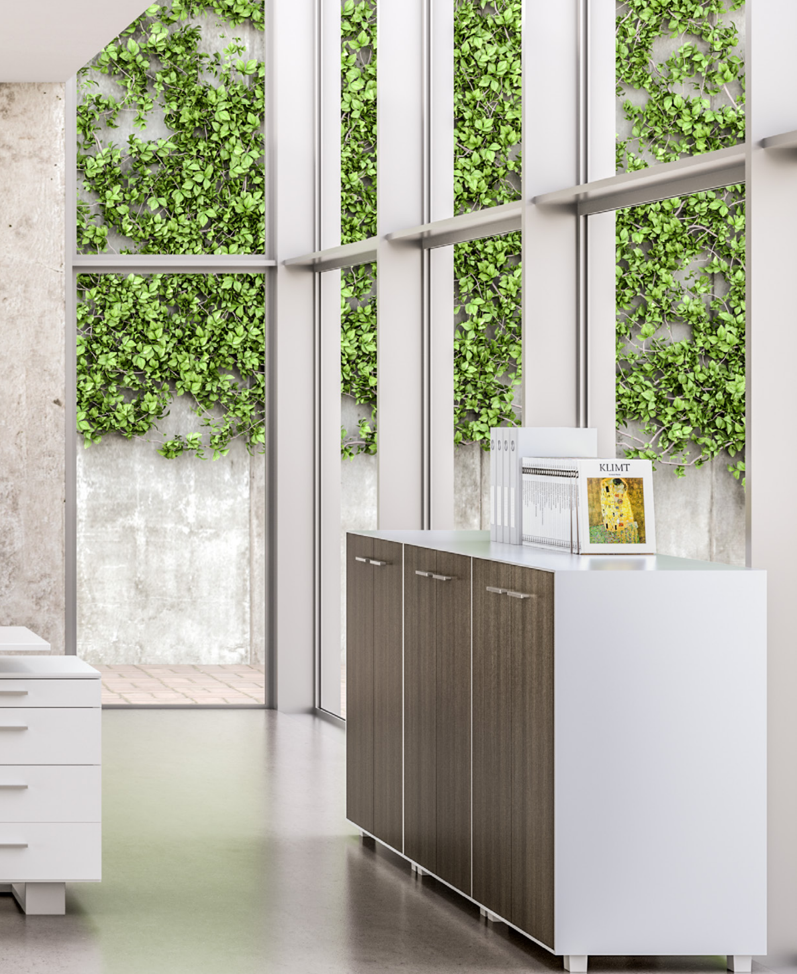
Collection EC6 (Modèle 635D-TC3) Collection Cuir Princesse (Papaye & Marron)